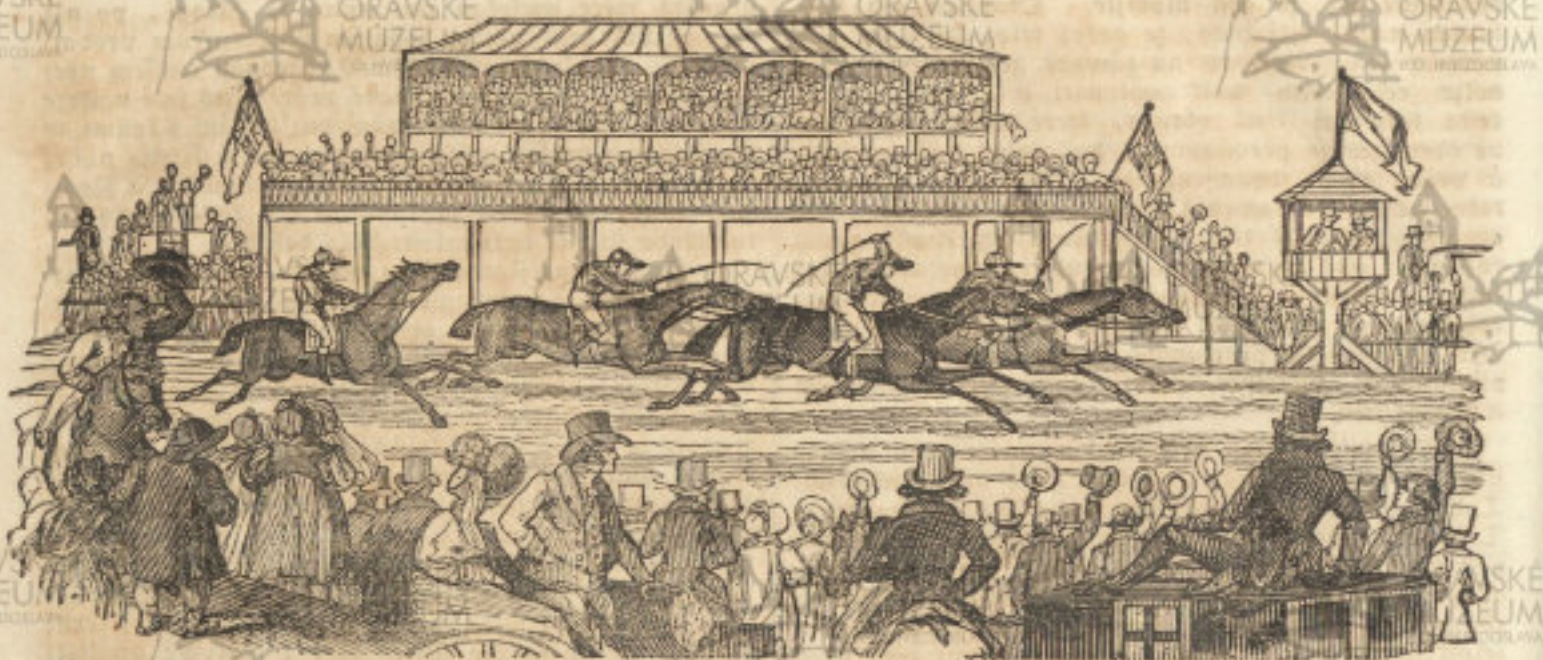
(Vizda w záwod w Angličanech.)

Gezdění w záwod bēge se rozličným způsobem. Buďto je jen dva koně pospolu a nageďnau běží, a toť geťt nevpřednějšší způsob základání se o záwod; anebo gich wíce, někdy do 10 pospolu, t ctiť tēťa, w kterěťto případy každý magitel gistať summu peněz w zálad sáží, dostávágej se tomu, gehoťz hontěťt wstěťně před ginyhmi cile doběhne.